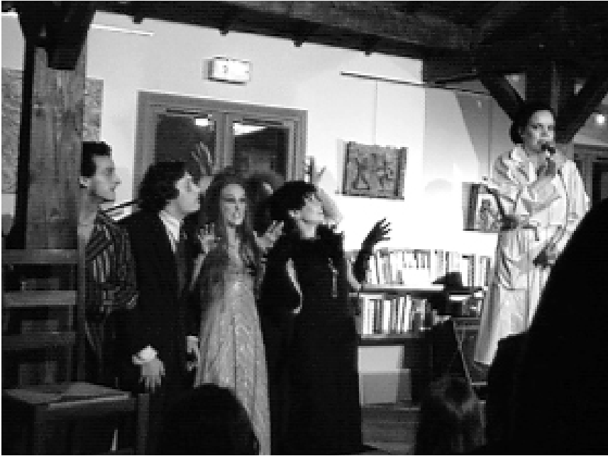
Le Cabaret de Bernard, Compagnie Rideau

M coups de cœur. Sensibles à cette dimension, nous avons organisé une séance de lecture sur le thème « Mon livre préféré » —un de nos grands moments ! Pour la première fois, les adhérents ont participé à la programmation. Suite à notre mailing, certains nous ont communiqué un titre qu'ils avaient particulièrement aimé. Deux professionnels de la compagnie Rideau (voir photo) ont articulé ces différents extraits de textes et les ont mis en voix. Des échanges riches, émouvants aux-