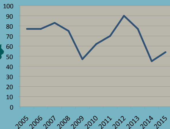
Evolution du nombre de structures accompagnées en PROVENCE-ALPES-CÔTE D'AZUR par le DLA

6,8% de l'ensemble des structures culturelles accompagnées par le DLA au national