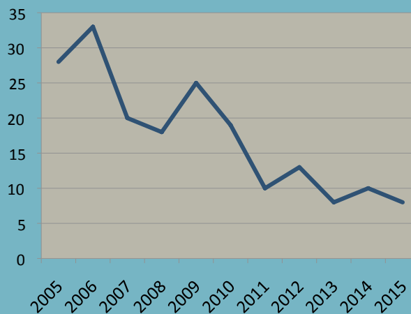
Evolution du nombre de structures accompagnées en BASSE-NORMANDIE par le DLA

de l'ensemble des structures culturelles accompagnées par le DLA au national